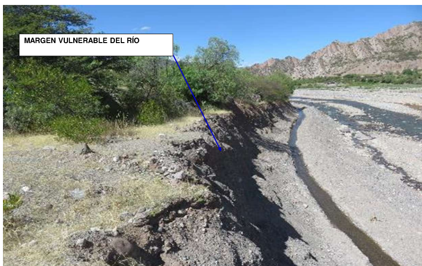
FIGURA N°01: VISTA DE LOS TERRENOS AGRÍCOLAS E INFRAESTRUCTURA DE RIEGO QUE CORRESPONDE AL SECTOR "UCHCO" LOS MISMOS SE ENCUENTRAN EXPUESTOS A RIEGOS DE AVENIDAS E INUNDACIONES DEL RIO CACHI.