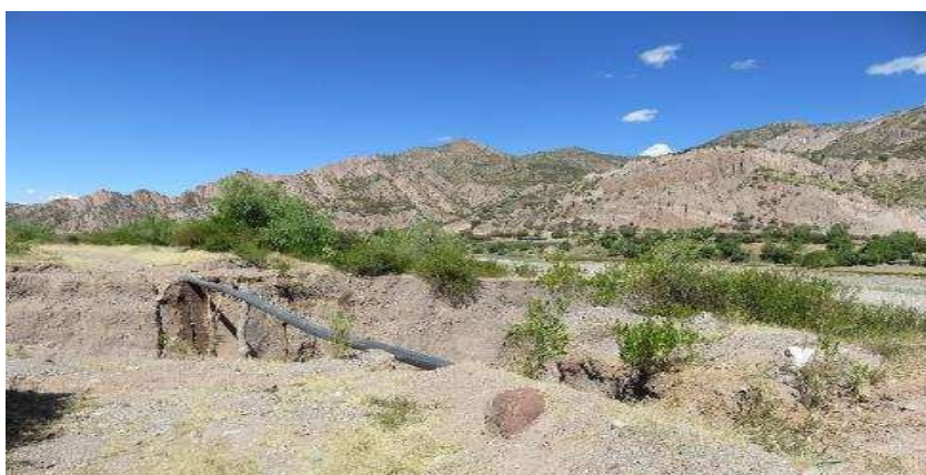
FIGURA N°03: VISTA DE LAS INFRAESTRUCTURAS VIALES Y DE CONDUCCIÓN EN EL SECTOR "UCHCO", CONSTA DE TROCHA CARROZABLE Y CANAL DE TUBERÍA PVC Ø 12".