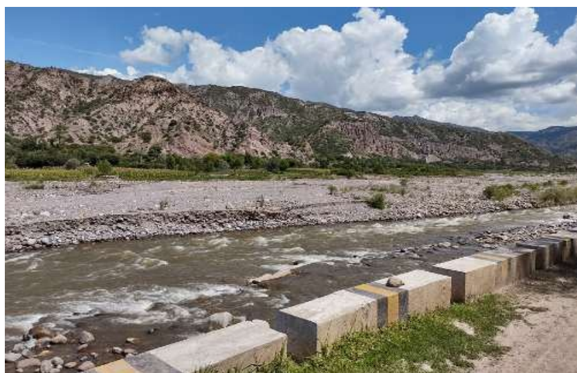
FIGURA N°02: VISTA DE LAS INFRAESTRUCTURAS VIALES Y DE CONDUCCIÓN EN EL SECTOR "UCHCO", CONSTA DE TROCHA CARROZABLE.